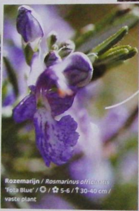
Rozemarijn / Rosmarinus officinalis "Fota Blue" ☉ / ☆ 5-6 / ↑ 30-40 cm / vaste plant

Roger: "In het algemeen, en dat zeg ik voorzichtig, bloeit de kruipende rozemarijn makkelijker dan de opgaande soorten."