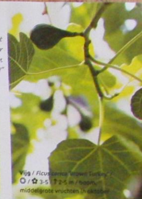
Vijg / Ficus carica 'Brown Turkey' ☉ / ☆ 3-5 / ↑ 2-5 m / laag, middelgrote vruchten in oktober

Roger: "Perfect winterhard met goed rijpende vruchten in ons klimaat is de vrij Ficus carica 'Brown Turkey'. In een extreem strenge winter vriezen ze weliswaar tot de grond toe af, maar hetzelfde jaar komen oude struiken terug met grondscheuten van 2 tot 3 meter!"