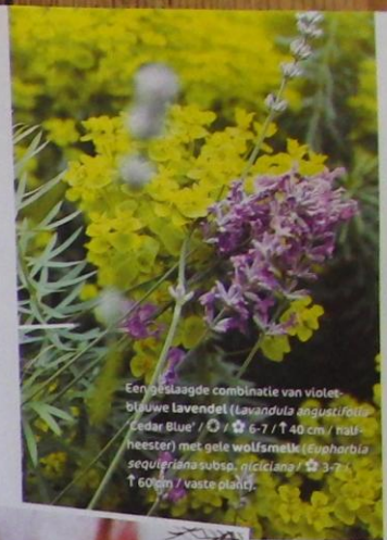
Een geslaagde combinatie van violet-blauwe lavendel ( Lavandula angustifolia 'Cedar Blue' / ☼ / 🌱 6-7 / ↑ 40 cm / half-heester) met gele wolfsmelk ( Euphorbia seguieriana subsp. giccliana ) / ☼ 3-7 / ↑ 60 cm / vaste plant.

Twee keer werd de afspraak met Roger Bastin (45) verzet. Niet zo gek. Want van een gerenommeerd kweker van mediterrane planten en houder van vijf Nederlandse plantencollecties, wil iedereen wel iets weten!