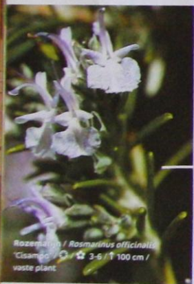
Rozemarijn / Rosmarinus officinalis "Cisampo" ☉ / ☆ 3-6 / ↑ 100 cm / vaste plant

Roger: "Cisampo is een eigenwijze plant, zoals alle rozemarijn. Hij doet wat hij wil."