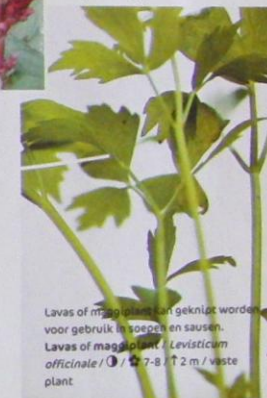
Lavas of maggoliplant kan geknipt worden voor gebruik in soepen en sausen. Lavas of maggoliplant / Levisticum officinale / ☉ / ☆ 7-8 / ↑ 2 m / vaste plant

Roger: "De Agastache 'Linda' is een eigen kruising. Het is een sterke plant, goed winterhard, die in het voorjaar uitloopt met diep donkerbruin blad."