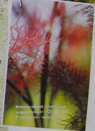
Bronzen Venkel / Foeniculum vulgare 'Rubrum' / ☼ / 🌱 7-9 / ↑ 100-150 cm / vaste plant.

Roger: "Deze venkel heeft prachtig bronsgroen blad. Hij is kortlevend, maar zaait zich op tijd uit, zodat je hem niet gauw kwijtraakt. Je moet zelfs op tijd het teveel aan zaadhoofden wegnippen, anders wordt het wel heel veel venkel!"