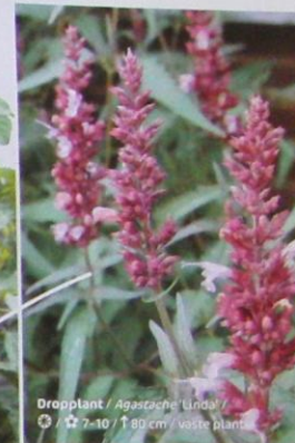
Dropplant / Agastache 'Linda' ☉ / ☆ 7-10 / ↑ 80 cm / vaste plant

Roger: "De Agastache 'Linda' is een eigen kruising. Het is een sterke plant, goed winterhard, die in het voorjaar uitloopt met diep donkerbruin blad."