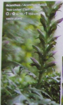
Acanthus / Acanthus mollis "Rue Ledan" ("Jeff Atbus") ☉ / ☆ 6-10 / ↑ 150 cm vaste plant

'Als je vriendschap sluit met een plant, wil je al zijn gezichten kennen'