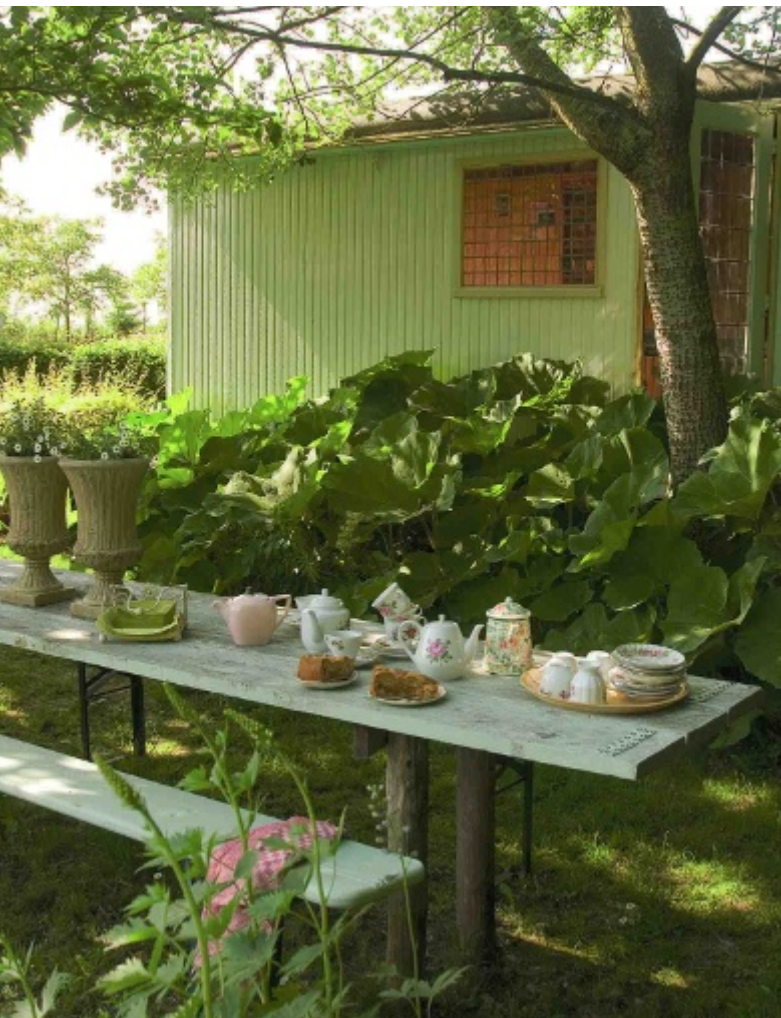
Het Houten Huis organiseert op verzoek ook high teas. Rechts: Een pioen wordt met de hand bestuift.